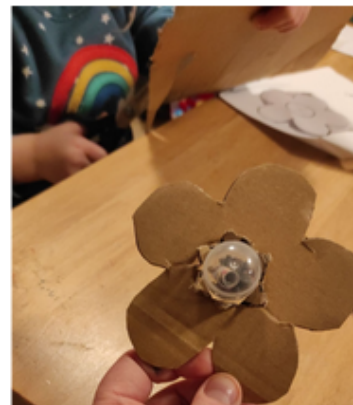
Jetzt nur noch bemalen